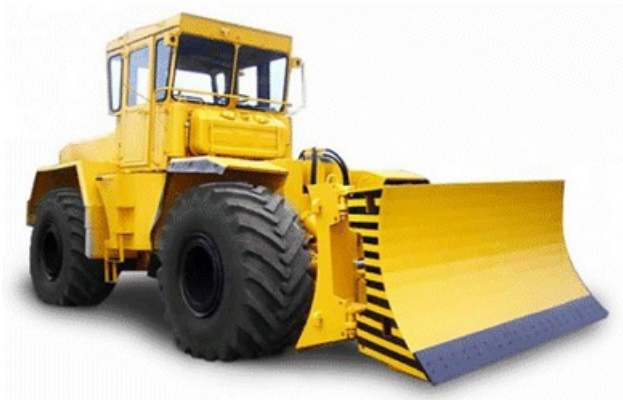
Рис.1. Бульдозер К-703-ДМ-15Т

2.4. Технологической картой предусмотрено выполнение работ комплексным механизированным звеном в составе: автомобили-самосвалы КамАЗ-55111 ( Q=13,0 т); машина универсальная уборочная КО-812-1 (на шасси трактора Т-40); бульдозер К-703-ДМ-15Т ( h_{отвала}=1520 мм, B_{отвала}=3750 мм, v_{раб}=7,6 км/ч); фронтальный погрузчик ТО-18 ( Q_{max}=3400 кг, g_{ковша}=1,9 м 3 , H_{разгрузки}=2800 мм; v_{раб}=6,7 км/ч).