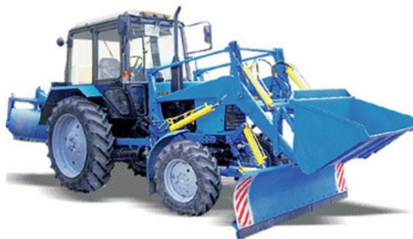
Рис.4. Машина уборочная КО-812-1

2.5. Работы по полной очистке участка автомобильной дороги от снега следует выполнять, руководствуясь требованиями следующих нормативных документов: