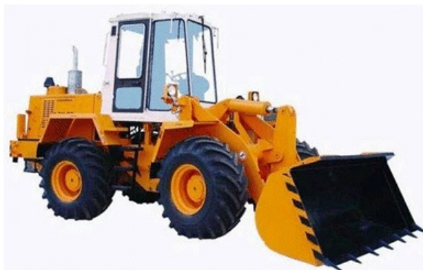
Рис.2. Фронтальный погрузчик ТО-18