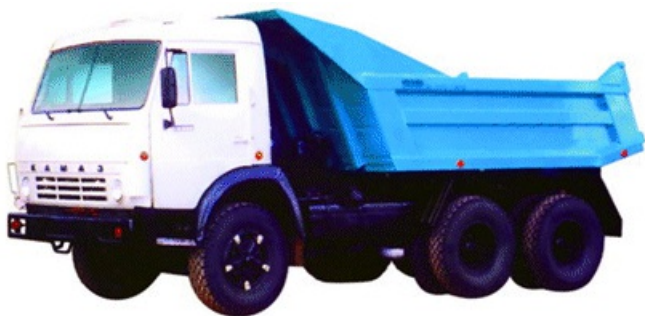
Рис.3. Автосамосвал КамАЗ-55111