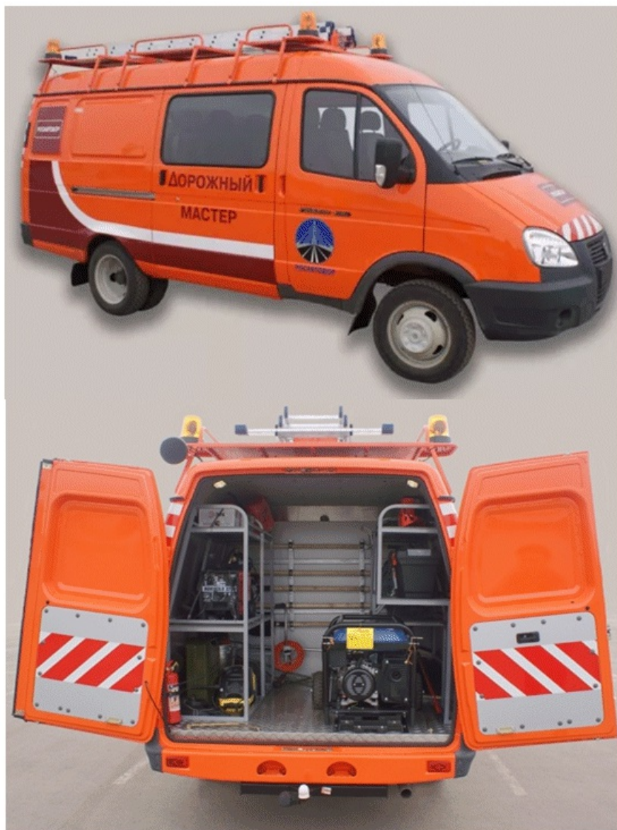
Рис. 1. Машина Дорожная Служба

(колёсная формула 4×2, грузоподъёмность Q=1,5 т, масса машины m_{\text{полная}}=3,5 т, габаритные размеры 1970×1840 × 1535 мм, мощность двигателя N_{\text{двиг.}}=107 л.с).