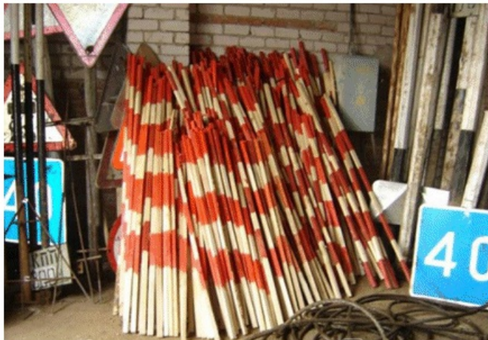
Рис.3. Заготовленные указательные вехи

На верхней части указательной вехи общей длиной 100 см рекомендуется попеременно наклеивать светоотражающую пленку белого и красного цвета (см. Рис.2) или окрашивать попеременно через 20 см черной и белой краской.